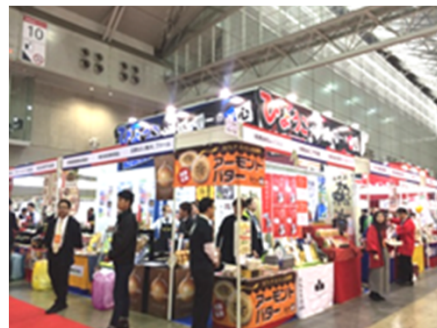
兵庫県ブースの様子