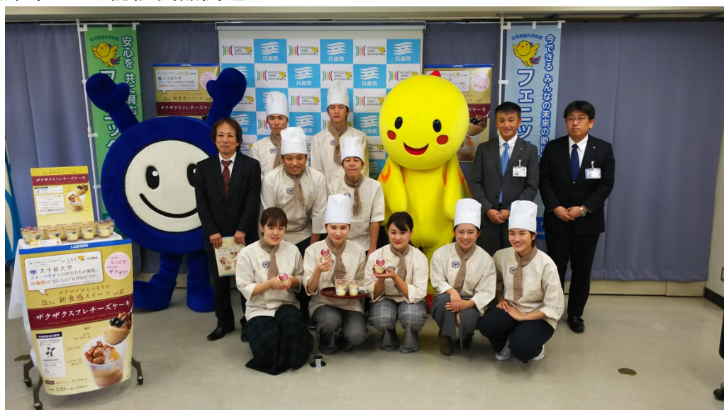
認証食品コンビニスイーツ 記者会見