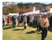
兵庫県認証食品フェスティバル

さらに、食品スーパー等が安全・安心な認証食品の取扱を積極的に求める推進を醸成することで、認証食品取扱量の増加につなげ、県民が認証食品を購入できる機会を拡大します。