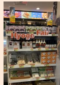
県産品展示販売コーナー

(R1: Fish Mart SAKURAYA West Coast Plaza店)