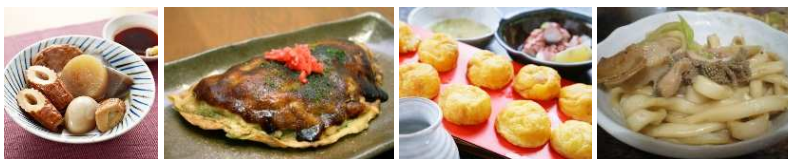
姫路おでん 高砂にくてん 明石たまご焼 佐用おもんうどん