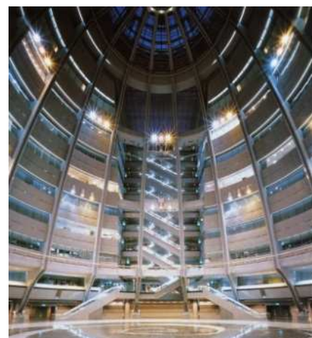
神戸ファッションマート アトリウムプラザ