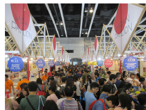
来場者で賑わう兵庫県ブース