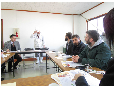
酒蔵との意見交換

内容：日本酒の輸出促進をテーマとして、海外から酒類業界の有識者を招聘し、セミナーの開催や、現地視察、現地商談を実施。