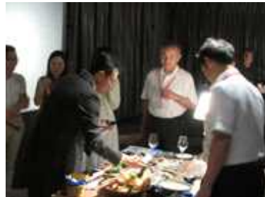
現地バイヤーによる明石鯛の試食