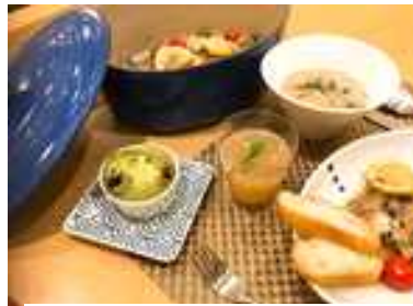
料理教室メニュー