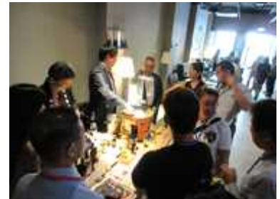
出展者による日本酒や食酢のプレゼン