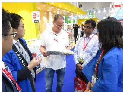
G-GAP 取得の有機米について説明