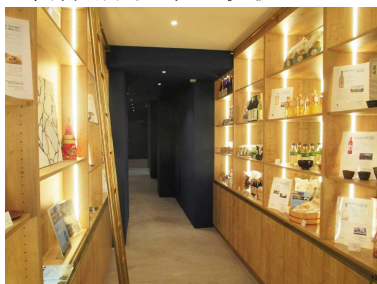
プロモーションショップでの商品展示