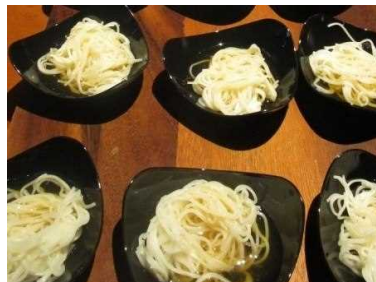
手延べそうめん揖保乃糸 (明石鯛・ワケ酵母使用の純米酒の出汁)