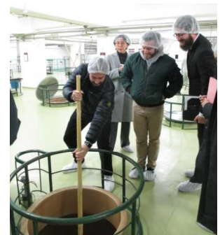
竹の棒を使った 仕込みを体験する招聘者