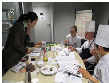
ミシュラン星付きレストラン等への営業代行