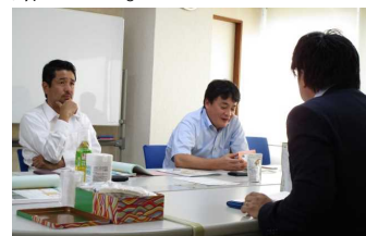
個別相談会において持参した商品の助言を受ける参加事業者