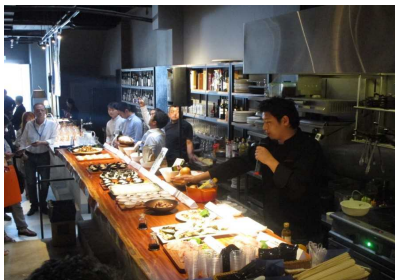
日本人シェフが調理、提供