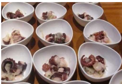
明石だこの和え物 (淡路島たまねぎ・但馬の生姜酢)