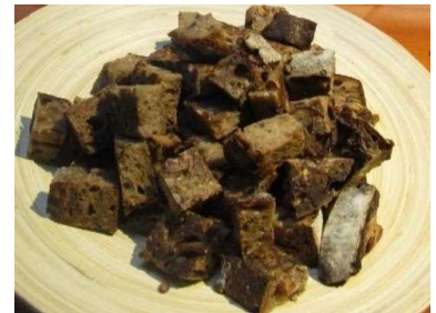
丹波黒炒り豆パン (六条麦焼酎・丹波黒煎り豆)