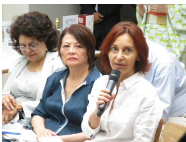
現地メディアとの質疑応答