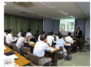
現地食品業界に詳しい講師 による事前セミナー