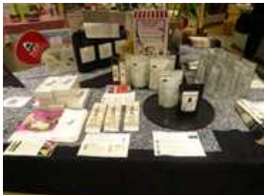
テストマーケティング

シンガポール中心部の中・高所得層を対象にした高島屋内「ＡＢＣクッキングスタジオ」で、明石だこや牡蠣（ハーフシェルオイスター）、日本酒を利用した料理教室を開催。また、同スタジオ内の販売棚等を利用し、今回のプロモーション商品（常温）の販売や試食等のテストマーケティングを実施。