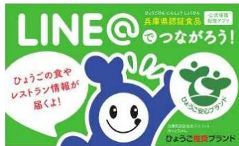
ライン紹介カード