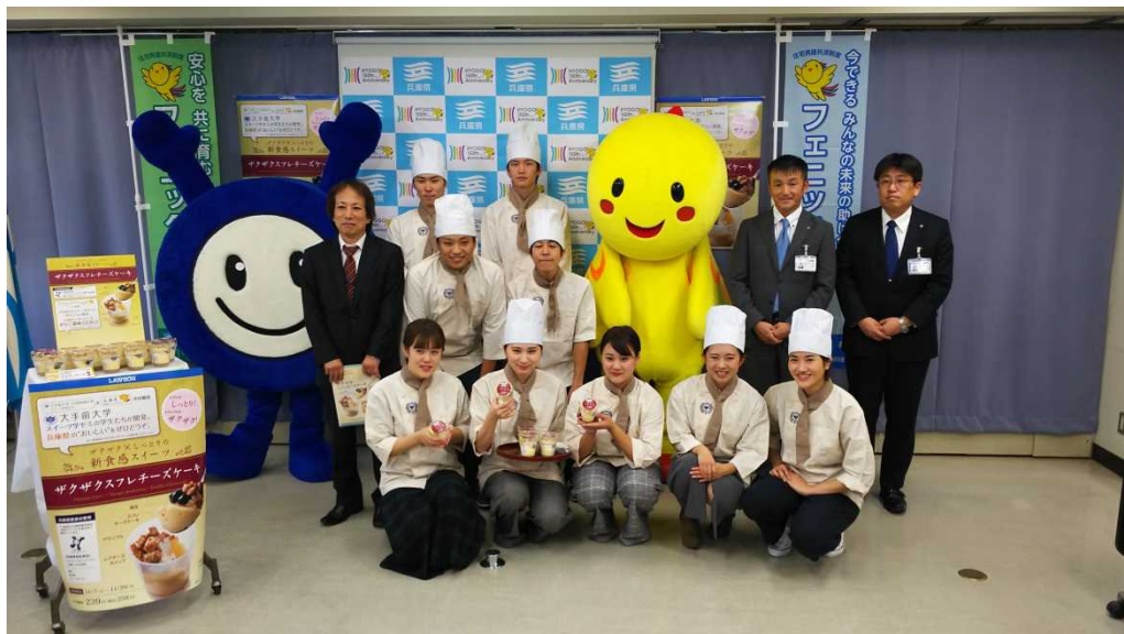
認証食品コンビニスイーツ 記者会見