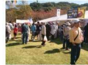
兵庫県認証食品フェスティバル

さらに、食販スーパー等が安全・安心な認証食品の取扱を積極的に求める推進を醸成することで、認証食品取扱量の増加につなげ、県民が認証食品を購入できる機会を拡大します。