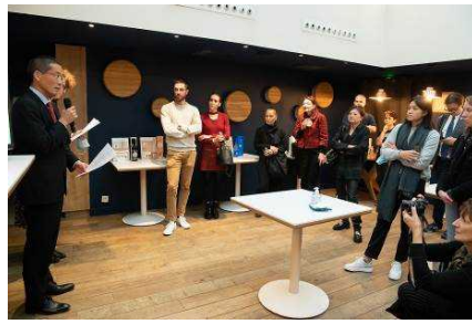
ひょうごサロンの様子