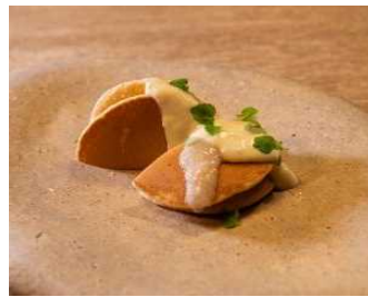
もち麦パンケーキ (甘酒のソース)