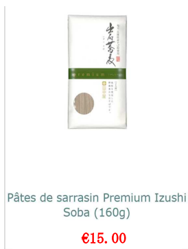
EC サイトでのテスト販売