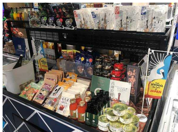
テスト販売の様子

主な品目：朝倉山椒オイル、香住ガニ甲羅盛り、もち麦パンケーキミックス、出石そば、日本酒等