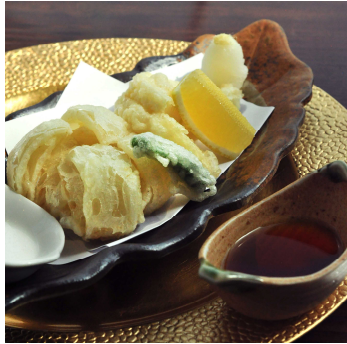
淡路玉ねぎ天麩羅