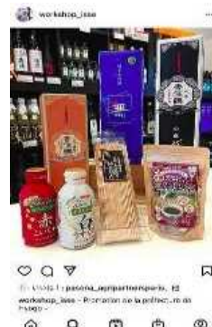
SNS での PR