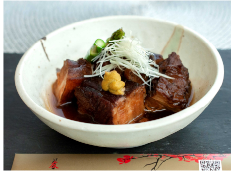
神戸ポーク バラ角煮