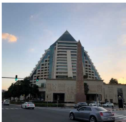
TOMO が入居しているラッフルズ ホテルバイ