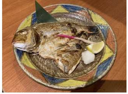
兵庫県食材を用いた料理