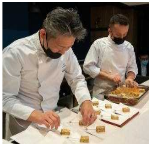
廻神シェフによる調理