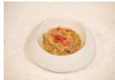
炒り玄米のリゾット