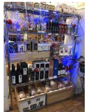
店舗でのテスト販売