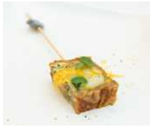
全粒粉うどんのオムレツ (お米と日本酒のソース)