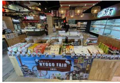
テスト販売の様子（SHIKISEN）