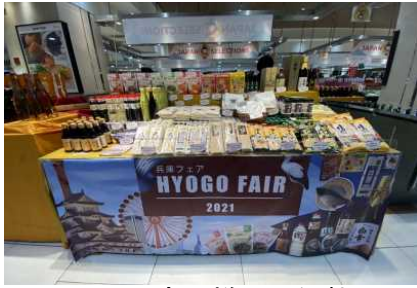
テスト販売の様子（伊勢丹）